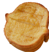
フレンチ(メイプル) 130円