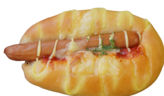
荒引きウインナー 180円