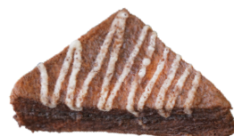
チョコフレンチ 160円