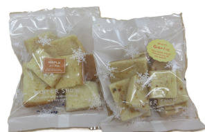
ラスク(メイプル・ガーリック) 50円