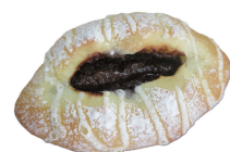
濃厚ベルギーチョコ 160円