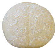
赤ちゃんのおしり(カスタード) 130円