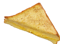
クロックムッシュ 180円