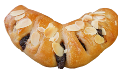
チョコっとくるみ 140円