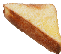
フレンチ(シュガー) 130円