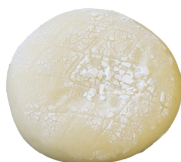
赤ちゃんのおしり(チョコ) 130円