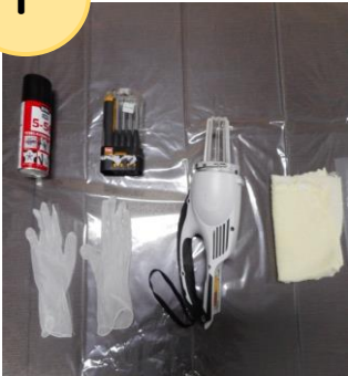
①準備について習う