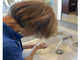
④実際の業務で活かす