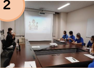
①事前に質問事項を考え、実際に聞く