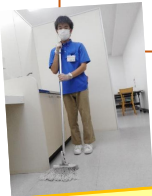
談話室でのモップがけ