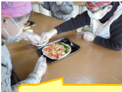
ぐ 具をのせて・・・