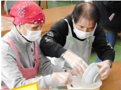
ざいりょう 材料をよく混ぜます