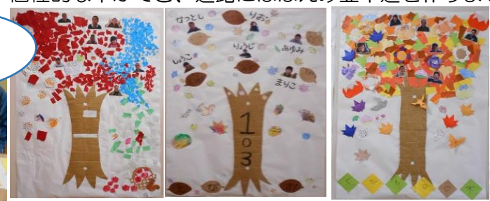
にじの木 やる気の木 果物の木