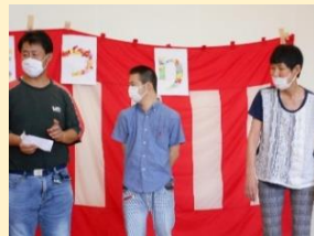
実行委員さんもゲームの手伝いを頑張りました！