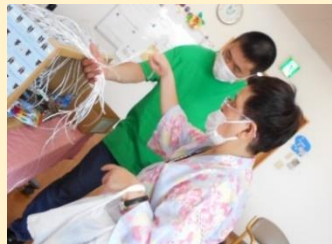
お菓子を吊り上げろ ひもくじ