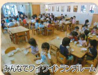
みんなでワイワイランチルーム