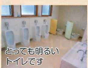
とっても明るいトイレです