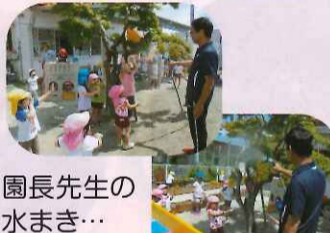
園長先生の水まき... (水遊び)