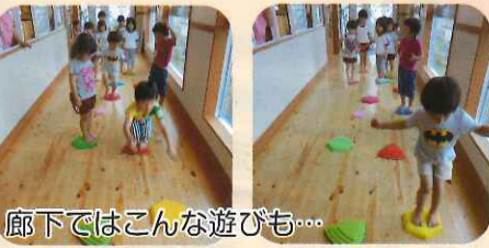
廊下ではこんな遊びも...