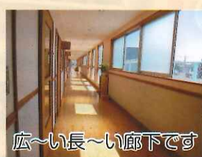
広~い長~い廊下です