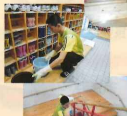
階段や靴箱をお掃除タイム