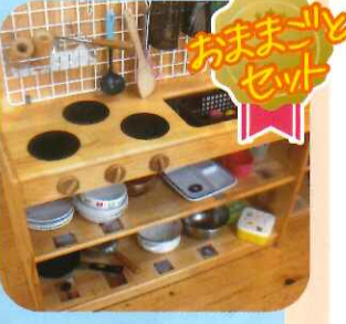
おままごとセット