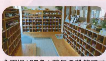
全園児167名+職員の靴箱です