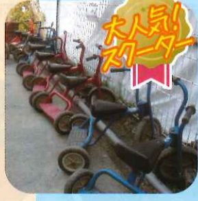
大人気スクーター