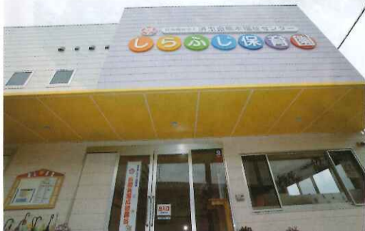
しらふじ保育園園舎

しらふじ保育園は定員160名、現在167名の元気な子ども達を通う、超明るい保育園です。年間行事も多く取り入れ、親子の触れ合いを多く取り入れるようにしています。