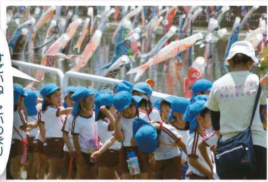
すこいねーこいのぼり

保育園では毎月いろいろな行事があり、子供たち、ご家族、職員と一緒に参加できる行事でいっぱいです。4月の入園式をスタートに、お見知り遠足、ファミリーデー(保育参観)、こいのぼり見学(年中組と年長組)、じゃがいも掘り(年長組)・・・毎月行われる、誕生会や避難訓練などなど、楽しいことがいっぱいの保育園、これからの報告をお楽しみに!!