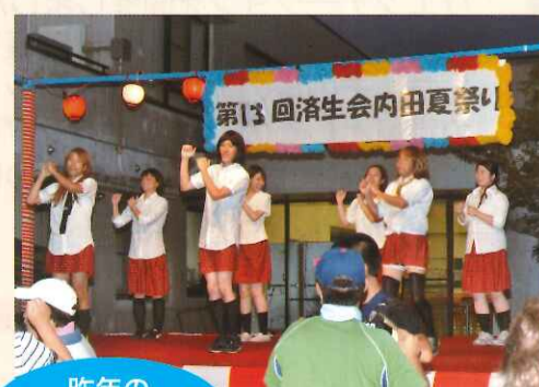
昨年の夏祭りの様子