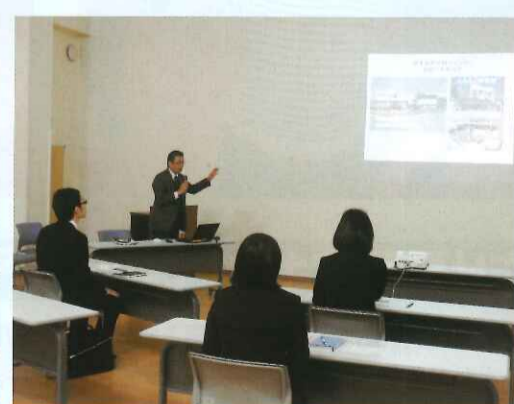
オリエンテーションの様子