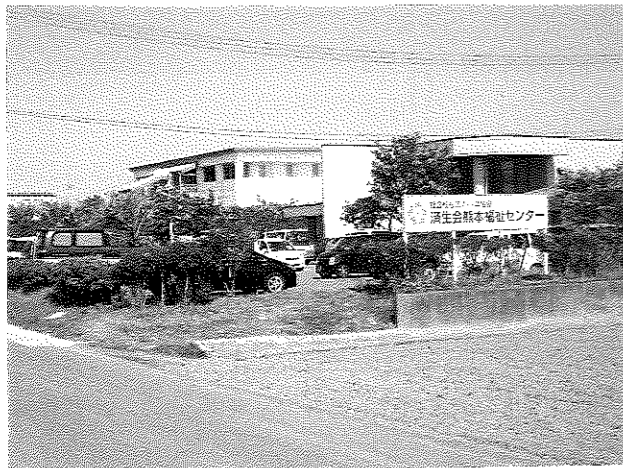
済生会熊本福祉センター外観

済生会は、明治天皇が医療によって生活困窮者を救済しようと1911年に設立された、日本最大の医療・福祉の団体としての社会福祉法人である。地域社会における医療サービスの提供と生活困窮者の救済を目標に、40都道府県で約59,000人の職員が医療・保健・福祉活動を展開している。その支部である熊本県済生会の歴史は、1935年に恩賜財団済生会熊本診療所を設立したことに始まる。2003年に旧国立療養所三角病院を引き継いで2つ目の済生会みすみ病院を開院し、2004年に他の社会福祉法人の就労支援や保育など6つの福祉事業を引き継ぐ目的で済生会熊本福祉センターが開所し、その後9事業にまで福祉事業を拡大し、現在に至っている。